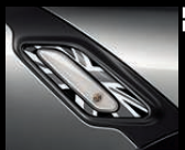
Side Scuttles Black Jack