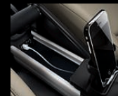
Universalhalter für Mobile Devices