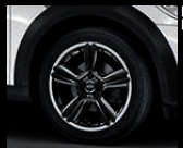
5-Star Double Spoke Composite R127 in Schwarz, Größe 7,5 J x 18 Zoll