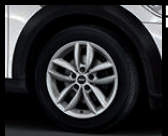
Double Spoke R124 in Silber, Größe 7 J x 17 Zoll, Winterrad