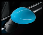
Außenspiegelkappen in Shocking Blue 2