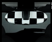
Innenspiegelkappe Checkered Flag