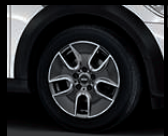
Tunnel Spoke R125 in Anthrazit, Größe 7 J x 17 Zoll