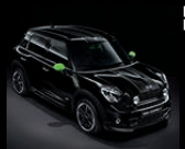
MINI RAY Paket in Alien Green 1