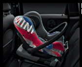
MINI Baby Seat Gruppe 0+