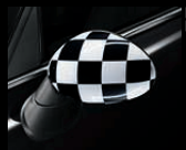
Außenspiegelkappen Checkered Flag