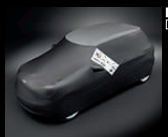
Car Cover In- und Outdoor