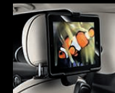
Travel & Comfort System Halter für Apple iPad (2 - 4) / iPad mini