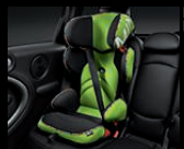
MINI Junior Seat Gruppe 2/3