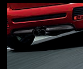
Diffusor aus Carbon