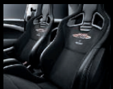
Sportsitze in Alcantara