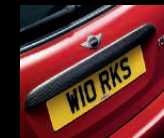
Heckklappengriff aus Carbon