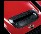
Lufteinlassblende aus Carbon