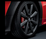
V-Spoke R133 in Schwarz matt, 7J x 18 Zoll