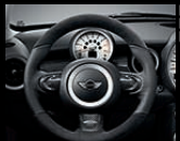
Sportlenkrad 1 in Alcantara, optional mit Carbonblende 2