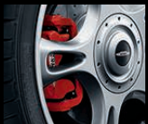
Sportbremse, 16 Zoll, mit gelochter und geschlitzter Brems Scheibe