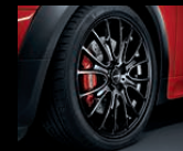
Cross Spoke R113 in Schwarz glänzend, 7J x 18 Zoll