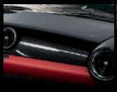
Interieuroberflächen aus Carbon