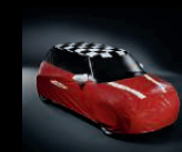
Car Cover Outdoor