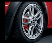
Double Spoke Composite R109, 7J x 18 Zoll