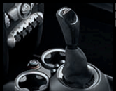
Schaltknäuf und -balg in Alcantara/Carbon