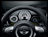
Zusatzinstrumente in Verbindung mit Always Open Timer (nur eins verbau- bar)