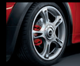
Star Spoke R95, 7J x 18 Zoll