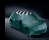
Car Cover Indoor