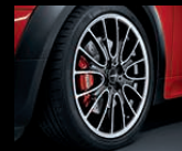
Cross Spoke R113 in Schwarz, glanzgedreht, 7J x 18 Zoll