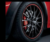
Cross Spoke R113 Red Stripe, 7J x 18 Zoll