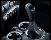
Schaltknäuf und -balg in Leder/Carbon