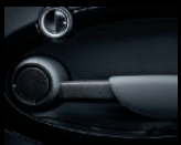
Türinnengriffe aus Carbon