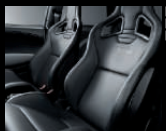
Sportsitze in Leder