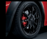
Double Spoke R105 in Schwarz matt, 7J x 18 Zoll