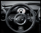
Sportlenkrad 1 in Leder, optional mit Carbonblende 2