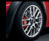
Cross Spoke Challenge R112, 7J x 17 Zoll