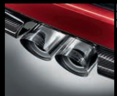
Sportschalldämpfer, Endrohrblenden, Chrom 1