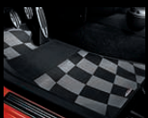
Fußmatten im Checkered Flag-Design