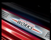
Einstiegsleisten mit Logo (beleuchtet oder unbeleuchtet)