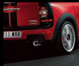
Sportschalldämpfer, Endrohrblenden, Chrom 1