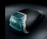
Car Cover Indoor