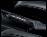
Handbremsgriff in Leder/Carbon