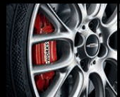
Sportbremse, 17 Zoll, mit gelochter und geschlitzter Brems Scheibe