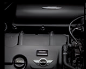
Motor mit optimierter Motorsteuerung 1