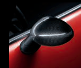
Außenspiegelkappen aus Carbon